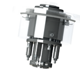
Auf und ab