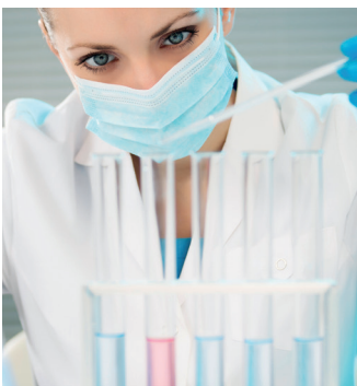
Chemie - Pharmazeutika