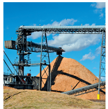
Bergbau - Steinbrüche

Die in diesen Unterlagen enthaltenen Angaben haben reinen Hinweischarakter. Die Firma LATTY international übernimmt keine Haftung für die Inhalte. Wir übernehmen keine Garantie für die Leistung unserer Produkte im Falle einer fehlerhaften Montage oder einer unsachgemäßen Verwendung, die nicht den Anweisungen entspricht. LATTY international haftet ausschließlich für die Qualität seiner Produkte und ist weder an der Montage noch an der Anwendung beteiligt, wobei diese nach dem Stand der Technik zu erfolgen haben.